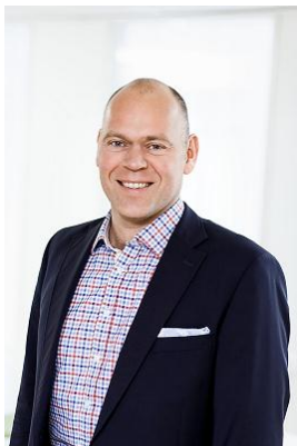
CEO Carl Ekvall

För att möta en förväntad efterfrågan och möjliggöra implementation och drift av ytterligare system behöver organisationen i England fortsatt förstärkas. Vidare finns det i marknaden behov av ny funktionalitet och nya applikationer. Vi ser därför över vår produktstrategi och vilka tekniska plattformar som marknaden kan komma att efterfråga. Kliniskt och funktionellt torde MobiMed Smart vara en av marknadens bäst utvecklade lösningar men det krävs en ständig anpassning till ny teknik och nya krav på integration. Våra framgångar i södra England stärker oss i tron på en fortsatt positiv utveckling för Ortivus.