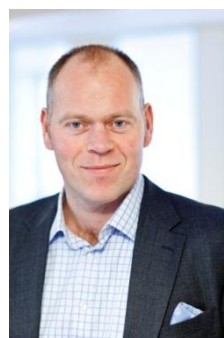
CEO Carl Ekvall

Ortivus erbjuder lösningar som kan bidra till både ökad effektivitet och sänkta kostnader inom såväl ambulanssjukvård som akutsjukvård och MobiMed Smart och MobiMed Emergency har funktionalitet och konkurrensförmåga som ger stöd för Ortivus fortsatta utveckling.