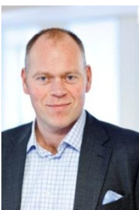
CEO Carl Ekvall

Som vi påpekat många gånger tidigare verkar Ortivus på en marknad som i stora delar är en ersättningsmarknad där affärsflödet är ojämnt och svårt att förutsäga. Tendensen är att upphandlingarna blir allt större och allt mer resurskrävande. För att möta den utvecklingen satsar Ortivus för närvarande stora resurser på att utveckla en plattform som ska bredda vårt erbjudande och öka möjligheterna till enkel integration med andra lösningar inom vården. Vi gör det i nära samarbete med kunder men också i samband med den typ av stora upphandlingar som nämnts ovan. Det är en kortsiktig utmaning, men en långsiktigt stor potential för bolaget.